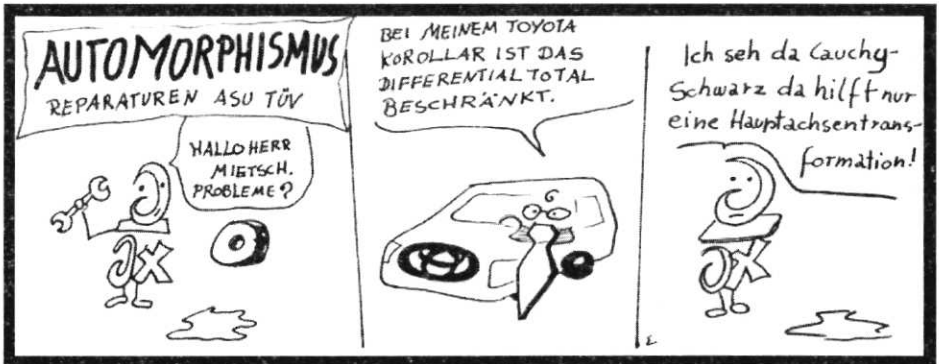
Abbildung 1: siehe Comics!